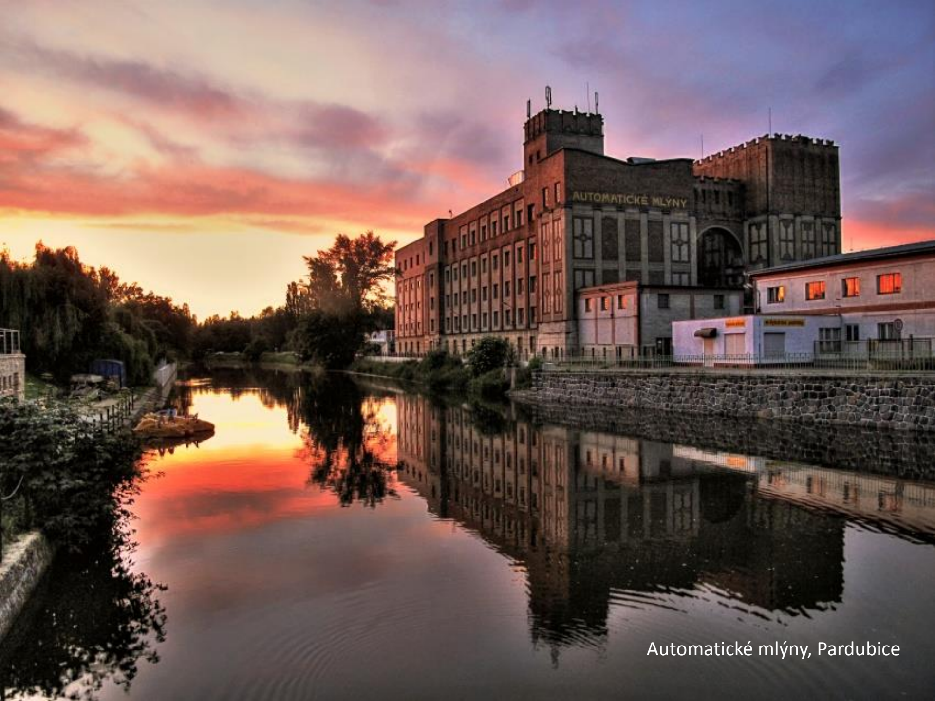
Automatické mlýny, Pardubice