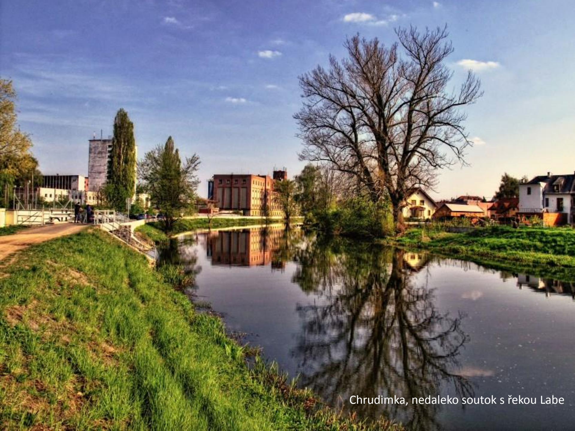
Chrudimka, nedaleko soutok s řekou Labe