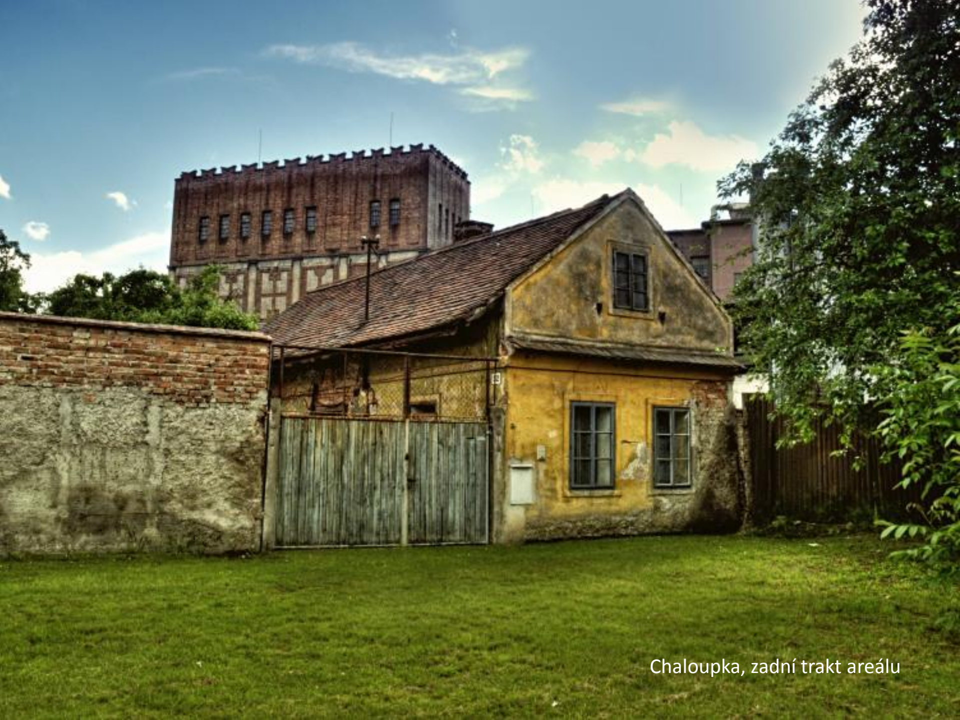
Chaloupka, zadní trakt areálu