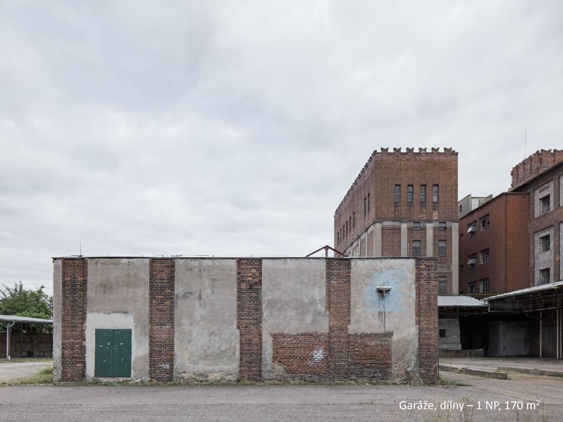
Garáže, dílny – 1 NP, 170 m 2