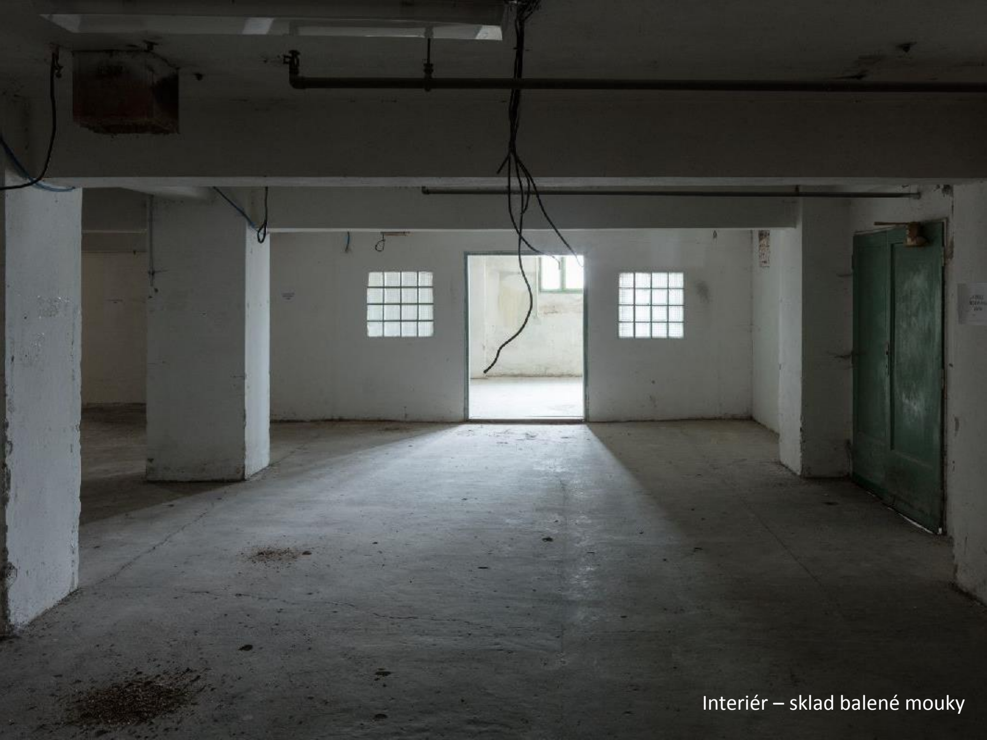
Interiér – sklad balené mouky